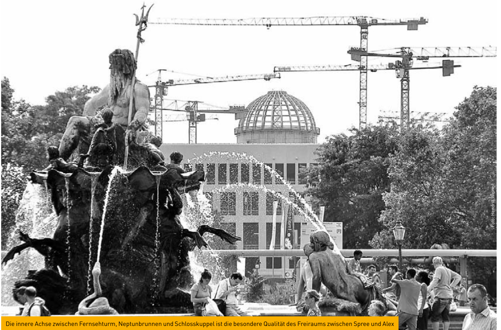
Die innere Achse zwischen Fernsehturm, Neptunbrunnen und Schlosskuppel ist die besondere Qualität des Freiraums zwischen Spree und Alex