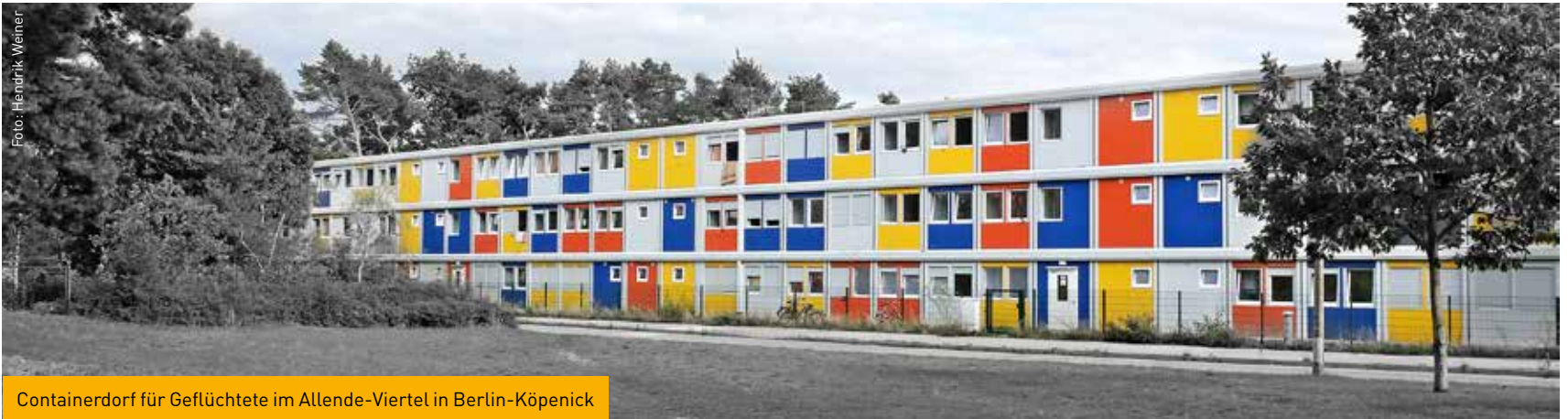
Containerdorf für Geflüchtete im Allende-Viertel in Berlin-Köpenick