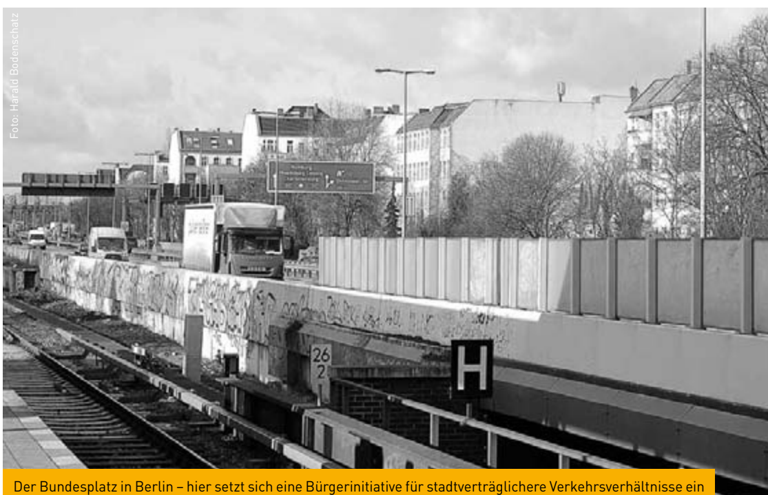
Der Bundesplatz in Berlin – hier setzt sich eine Bürgerinitiative für stadtverträglichere Verkehrsverhältnisse ein

Während der nationalsozialistischen Herrschaft sollte die Reichshauptstadt Berlin zu einer